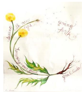
Van machteloosheid naar Actieve hoop

Het kapitalisme heeft ons als mens tot een monster gemaakt. Het enig zinnige antwoord hierop is te zeggen: "In Godsnaam stop er mee!!" Laat zien dat je het er mee eens bent, want we doen er allemaal aan mee. Want we moeten overleven dus we doen mee aan de consumptie-maatschappij.